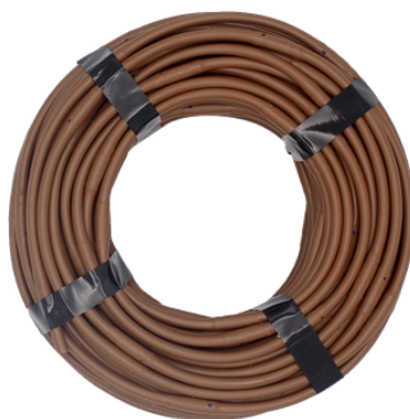
Micro-kapková trubka 15cm