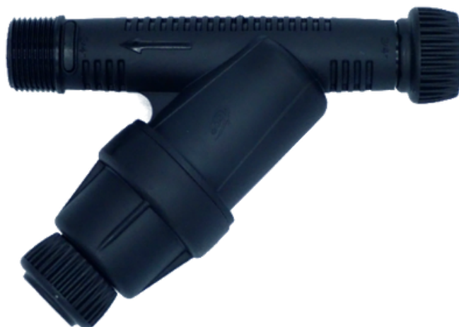
Filtr 3/4" s regulátorem tlaku 1,5 bar