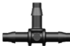
T - kus