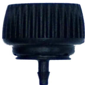
Spojka 3/4" x 4 mm