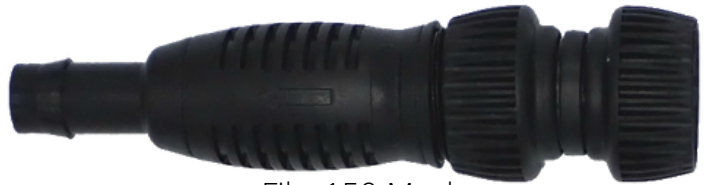
Filtr 150 Mesh