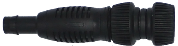
Filtr 150 Mesh