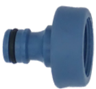
Rychlospojka s 3/4" závitem